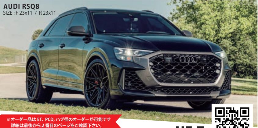
AUDI RSQ8 SIZE : F 23x11 / R 23x11

※オーダー品は ET、PCD、ハブ径のオーダーが可能です 詳細は最後から 2 番目のページをご確認下さい。