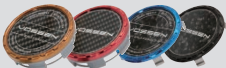
Hybrid / Twill Weave / Brickell Bronze