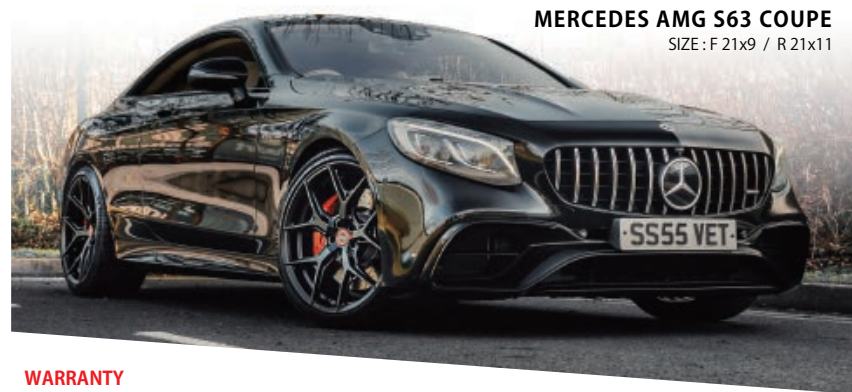
SIZE : F 21x9 / R 21x11