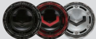
Satin Black / Black Insert